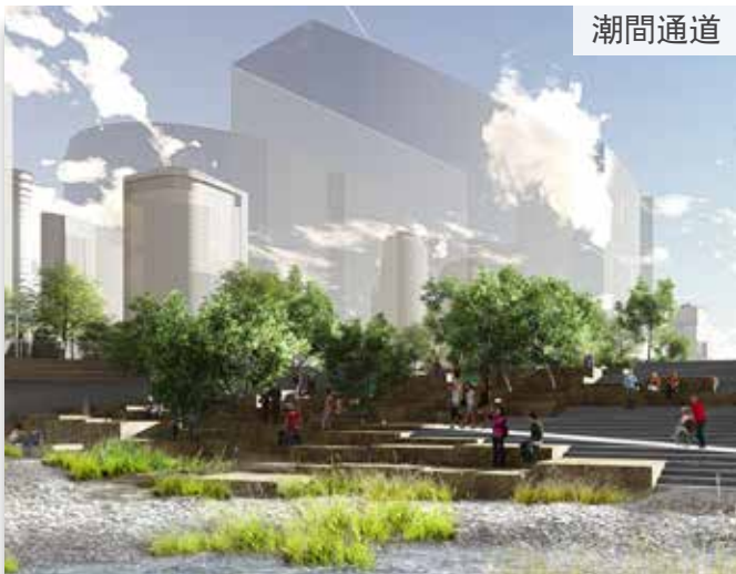
登斯梅瞭望台 (Dunsmuir Lookout)