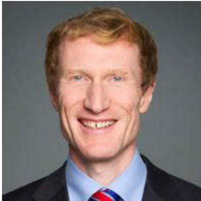
Honourable Marc Miller