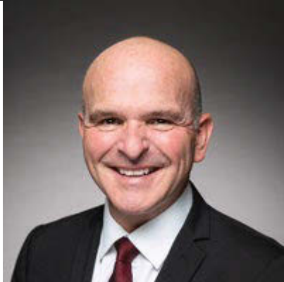
Honourable Randy Boissonault