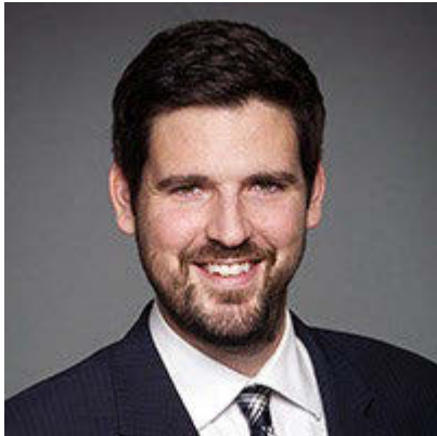
Honourable Sean Fraser