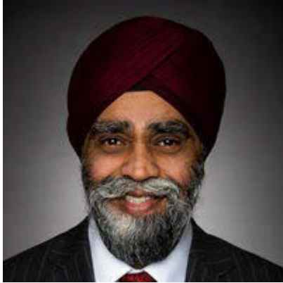
Honourable Harjit S. Sajjan