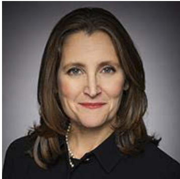
Honourable Chrystia Freeland