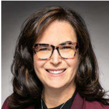
Honourable Ya'ara Saks