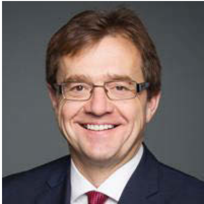
Honourable Jonathan Wilkinson