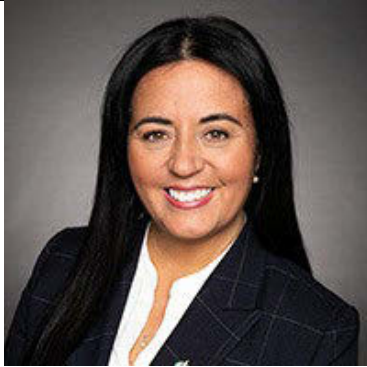
Honourable Soraya Martinez Ferrada