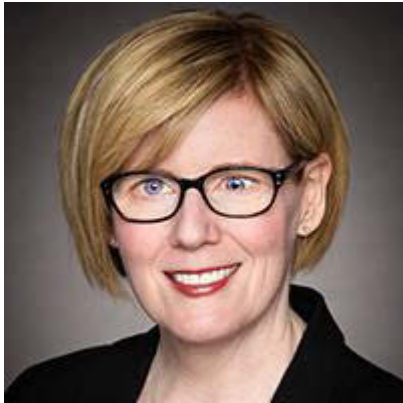
Honourable Carla Qualtrough