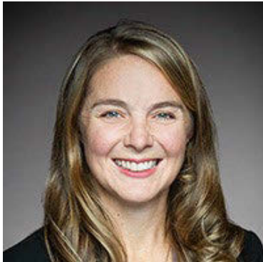
Honourable Jenna Sudds