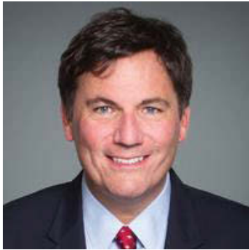
Honourable Dominic LeBlanc