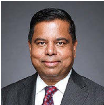
Honourable Gary Anandasangaree