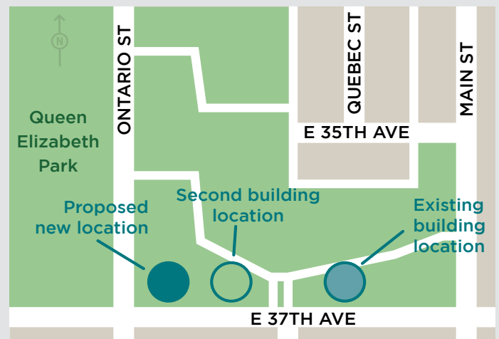
地圖2: 建議中的tə cecəw (The Beach) 及第二棟房屋的新位置

各項目夥伴會在落實有關第二棟房屋未來計劃的細節之後，致力向社區傳達最新消息。預料於2021年底之前會有更多資訊可以分享。