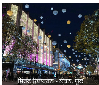
ਸਿਰਫ ਉਦਾਹਰਨ - ਲੰਡਨ, ਯੂਕੇ