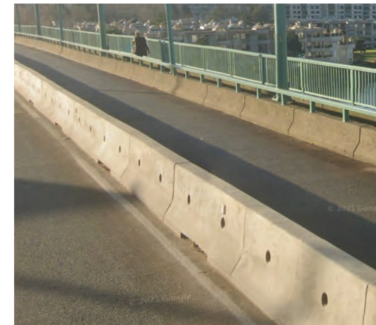
將在雷默街上用作限制行人及車輛橫越鐵路的混凝土路障示例。