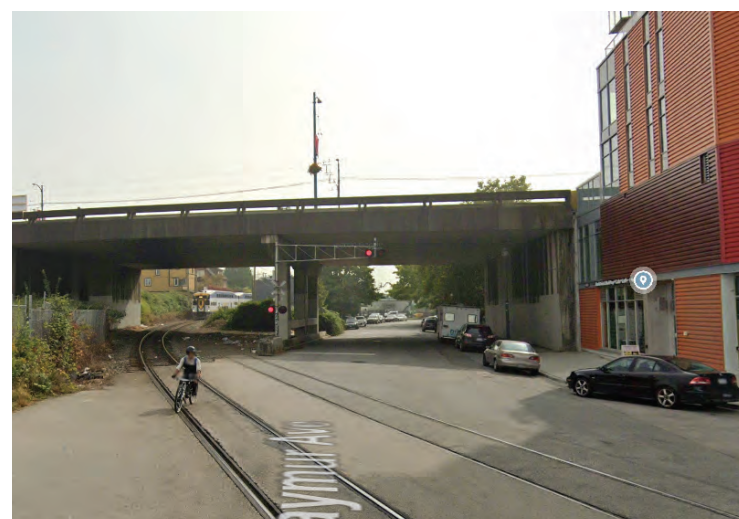
現時從雷默街南望所見的布勒內灣線及喜士定架空天橋 (Hastings Overpass)。

這將協助減低鐵路鳴鐘警示系統所帶來的噪音，並改善本地居民的生活質素。科多瓦東街 (E. Cordova Street) 的交叉口現時符合聯邦規定，因此目前不建議進行任何變更，但未來可能會考慮禁止機動車輛使用。雷默鐵路交叉口關閉將於 2021 年夏季/秋季實施。