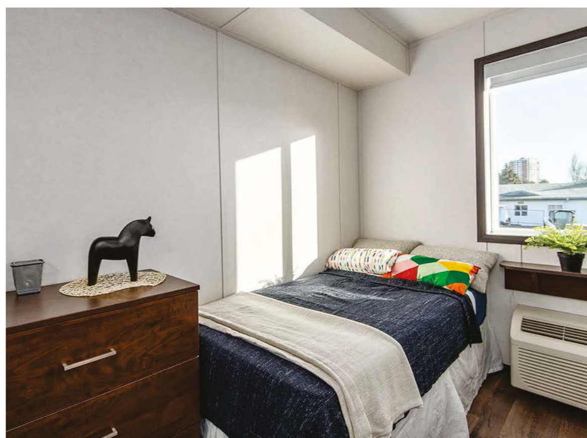
Heather Street 7430 及 7460 號