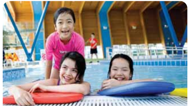
位於 Hillcrest Park，前身為 Vancouver Olympic/Paralympic 康樂綜合大樓，首期工程完成並已開幕。