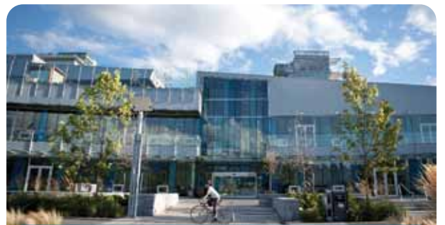
冬季奧運會後，令人驚歎的 Creekside Community Recreation Centre 在福溪東南面的奧運村海濱開幕。