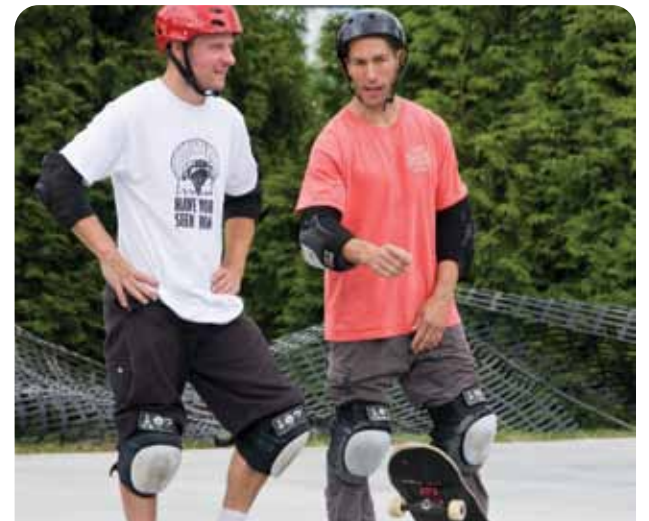
Kensington 滑板場竣工日立即投入使用

2010 年對滾軸愛好者來說，又有一件可喜可賀的事。公園局增加了兩處全新設施，是專為玩滑板、BMX 單車及山地車的人提供場地。位於 Kensington 公園的全新滑板場於去年 7 月開放，是溫哥華第七個公眾滑板場，受到當地用家的歡迎。該仿古滑板場飾有彩色瓷磚，活像美國加州充當滑板場的空置游泳池，設計風格為本省低陸平原獨有。滑板場還配備具有挑戰性的牆式階梯、斷層、小型斜坡道，可幫助滑板者展示各種特技動作，並設觀眾看台區。而在 Vanier Park 內，BMX 單車及山地車愛好者於去年 9 月擁有了第一座單車公園，園內設有泥地斜坡和跳躍點，並可調節至適合初學者、中級玩手及專業玩手的難度。公園局還將於今後擴建一個小型的 pump track 車道，觀眾可在寬大舒適的水泥長椅上欣賞表演。單車公園的成功有賴於單車愛好者們的協助，比如當泥地跳躍場過於潮濕時停止使用；當場地乾燥，灑水防止塵土飛揚，當場地有磨損時，可進行適當修補。