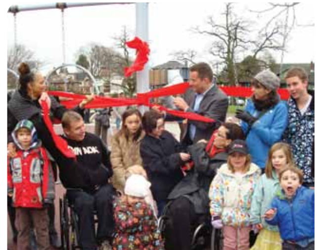
在新遊樂場正式開幕的慶祝活動上，溫哥華 Man in Motion 及積極倡議傷健人士權利的 Rick Hansen (持緞帶者) 在會上發表了很有意義的演說。

去年 12 月，有許多兒童慶祝一個位於海濱全市最大的全能遊樂場在美麗的 Kitsilano Beach Park 開幕。這是溫哥華、威士拿、列治文，三個 2010 年冬奧主辦城市新增的全能遊樂場之一，這項紀念冬季奧運會的設施既安全，亦能為市民提供富有想像力的活動、感官體驗及娛樂，是一個適合兒童與親友一同玩耍和探險的場地；遊樂場可供輪椅出入，方便身患傷健的父母及看護人員進入場地。遊樂場的設施包括設計方便的沙盤、旋轉攀架、碟形鞦韆及以史丹利公園被大風刮倒的林木而製成的座椅。與公園局合作設計及建造這個國際級遊樂場的伙伴包括 Ronald McDonald House Charities of Canada、Rick Hansen Foundation、2010 Legacies Now、卑詩省、Coca-Cola Canada 和 Shane's Inspiration。