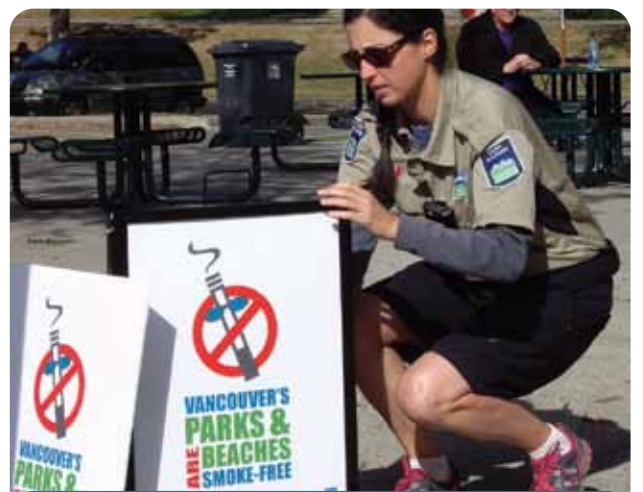
色彩鮮豔的標記可提高市民對禁煙的意識，範圍已擴展到停車場、街道和公園範圍的行人道。

這條例是廣泛的，受影響的人士包括市民、遊客、使用公園的人群、員工、承包商和義工。透過教育，計劃的首年目標是自願遵守 - 由公園管理員引導公眾有關訊息。支持禁煙的社區伙伴團體包括 Clean Air Coalition、Canadian Cancer Society ( BC & Yukon )、Vancouver Coastal Health 及 Vancouver Fire & Rescue Services。