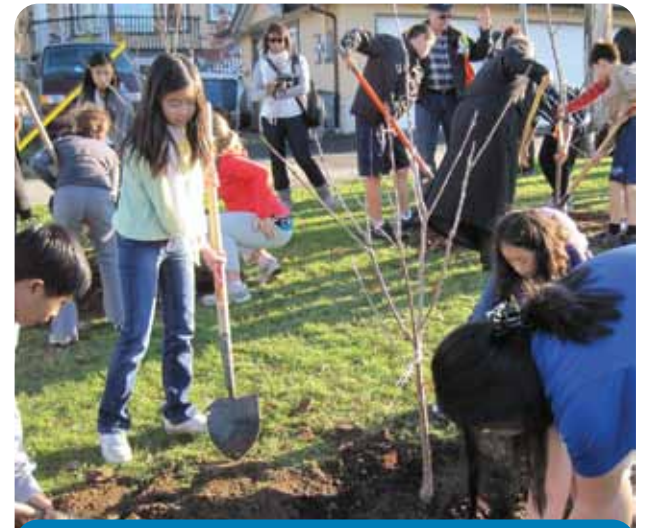
學生、教師和社區合作伙伴一起來到溫哥華東區，為市內公園栽種首個(共 3 個)果樹園。

25 株小果樹 - 蘋果、櫻桃、梅、梨和桃子 - 為去年 11 月公園局社區管理工作中，第一個種植在 Falaise Park 果園的展覽焦點及活生生的標誌。Vancouver Christian School、Renfrew Elementary School、Windermere High School、Renfrew Collingwood Food Security Institute 的學生，會利用果樹作為生態項目的教材。該項目按照 City's Greenest City Action Team 的建議，在 2020 年前種植 15 萬棵植物。這亦是公園局的承諾，去推廣都市農業可持續發展的做法和食品安全。這些樹木不是觀賞植物 - 當地居民可以從中採摘水果。The Falaise Park 的位置很理想，可提供充分的日照，空氣流通，附近亦有水供應。一個由 Kwantlen Polytechnic University 學生設計的昆蟲花園，將安置在果園中，來控制害蟲和給植物授粉。